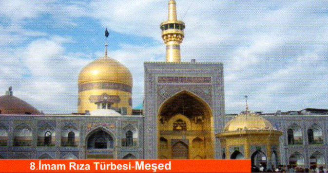
8. İmam Rıza Türbesi-Meşed