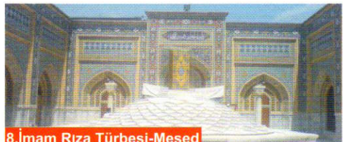
8. İmam Rıza Türbesi-Meşed

Sabah kahvaltısını mütaakiben erken bir saatte Alevi inancı için çok önemli yerlerden biri olan Erdebil'e gidiyoruz. Erdebil'de Alevi inancının Yedi Ulu Ozan'larından biri ve Safavi devletinin kurucusu olan Şah İsmail Hatayi'nin Türbe'sini ziyaret edeceğiz. Akabinde Şeyh Safiyeddin'in (Safi ad-Din) türbesi, camii ve müzesini gezeceğiz. Buraların aynı zamanda